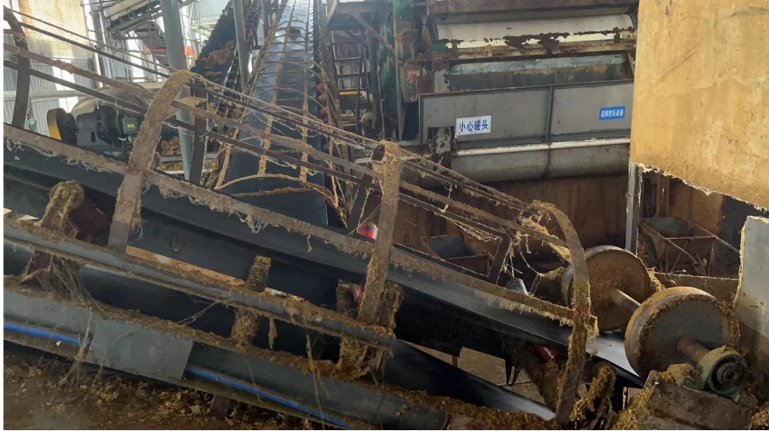
事故发生场所设备（磨机传输带）