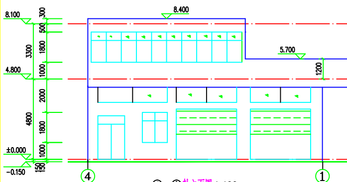
⑤—⑥ 轴立面图 1:100

注:1. 立面等面均采用75x75光面砖,颜色由甲方自定。 2. 所有外墙装饰材料(包括色样等)应由甲方确认后力可使用