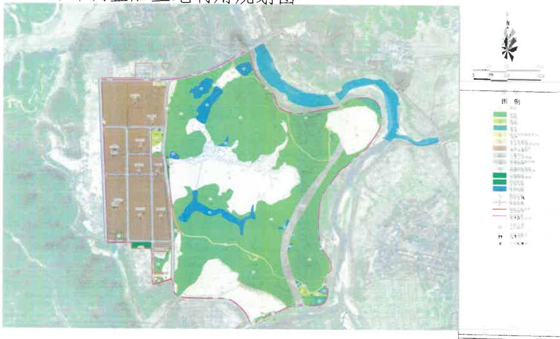
局部调整前后土地利用规划图对比