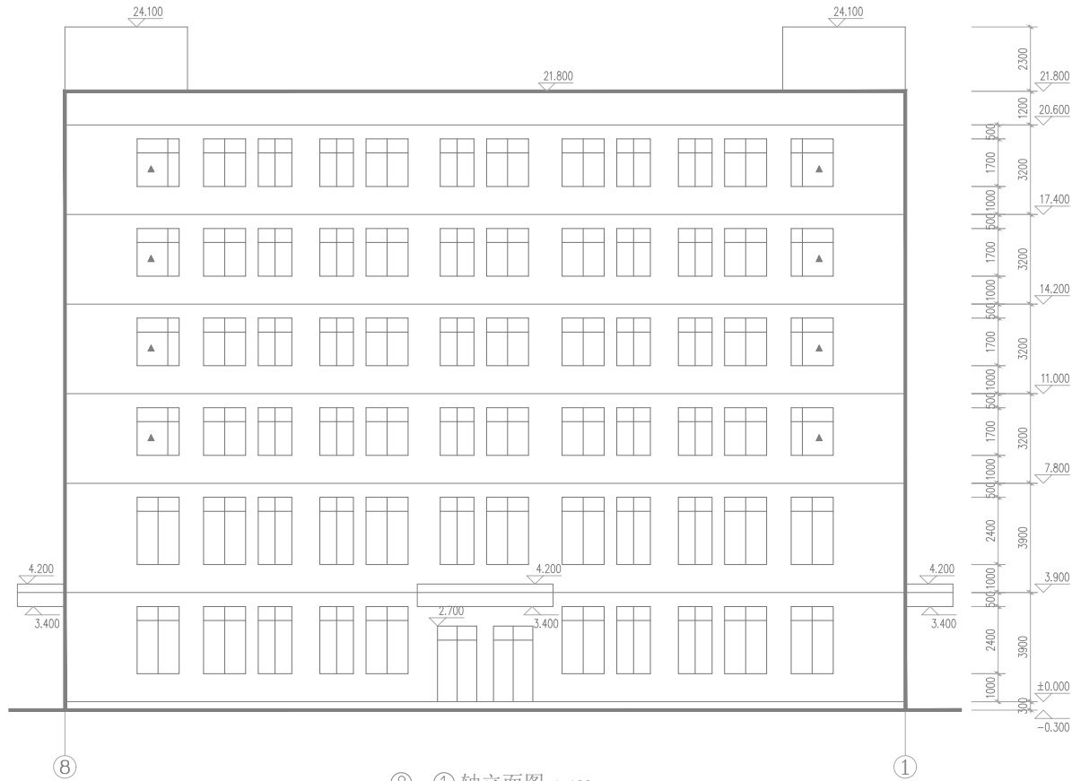
⑧ - ① 轴立面图 1:100