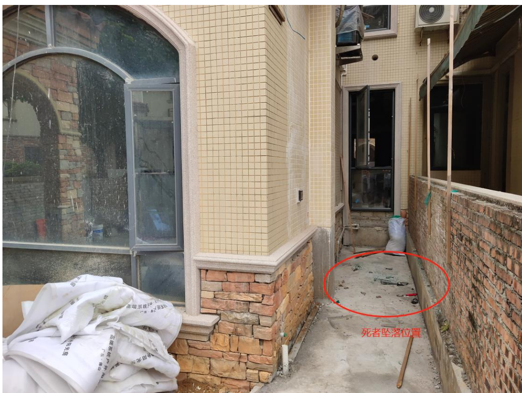
图 2 死者坠落位置如图所示