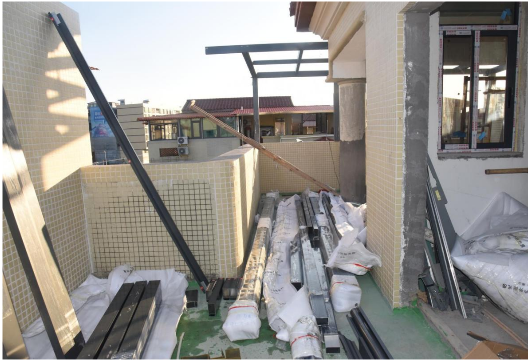
图 4 别墅楼顶雨棚（阳光房）施工现场