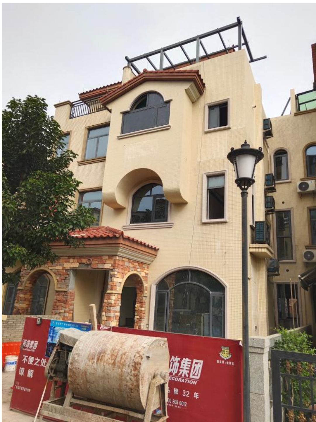
图 1 涉事别墅外立面