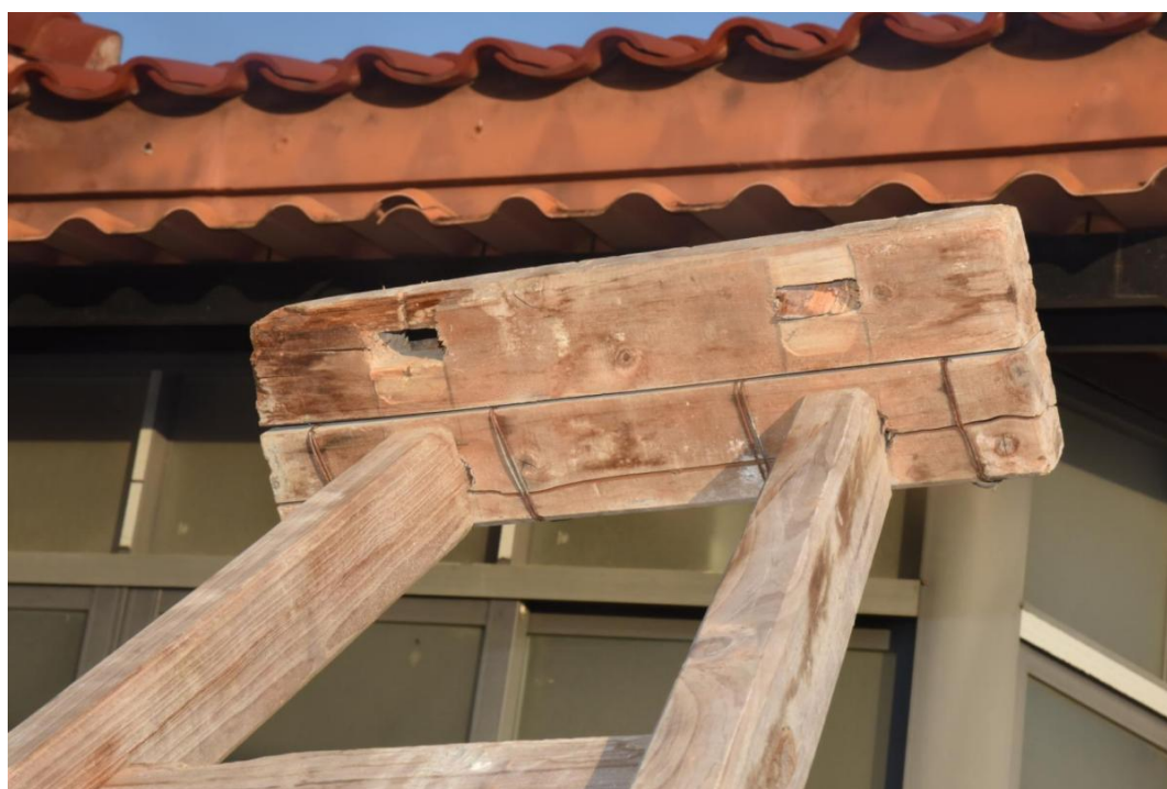
图 3 施工过程中散架的木梯